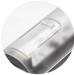
Fijación magnética sobre soporte atornillado